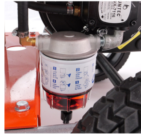
Filtro de Combustible