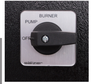
Control de Quemador