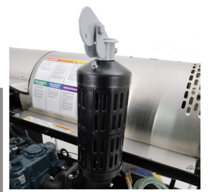
Operado por Diesel