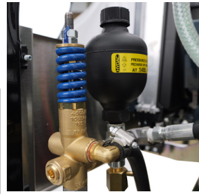
Descargador y Amortiguador de Pulsaciones